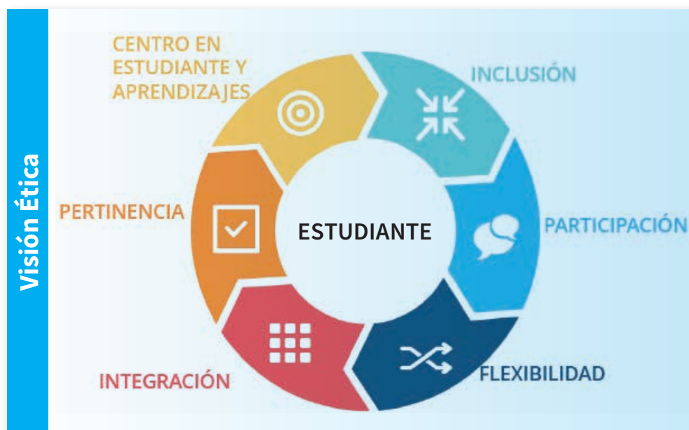
Figura 1 – Principios del Marco Curricular Nacional

Un modelo curricular integral y coherente debe responder a lógicas que trasciendan las especificidades propias de los diferentes niveles educativos encontrando una visión común desde principios que le otorguen sistematicidad y que hagan realidad la centralidad del estudiante como razón de ser del sistema educativo nacional. Por ello, además de los principios rectores de la educación se presenta un conjunto de principios que orientan al Marco Curricular Nacional.